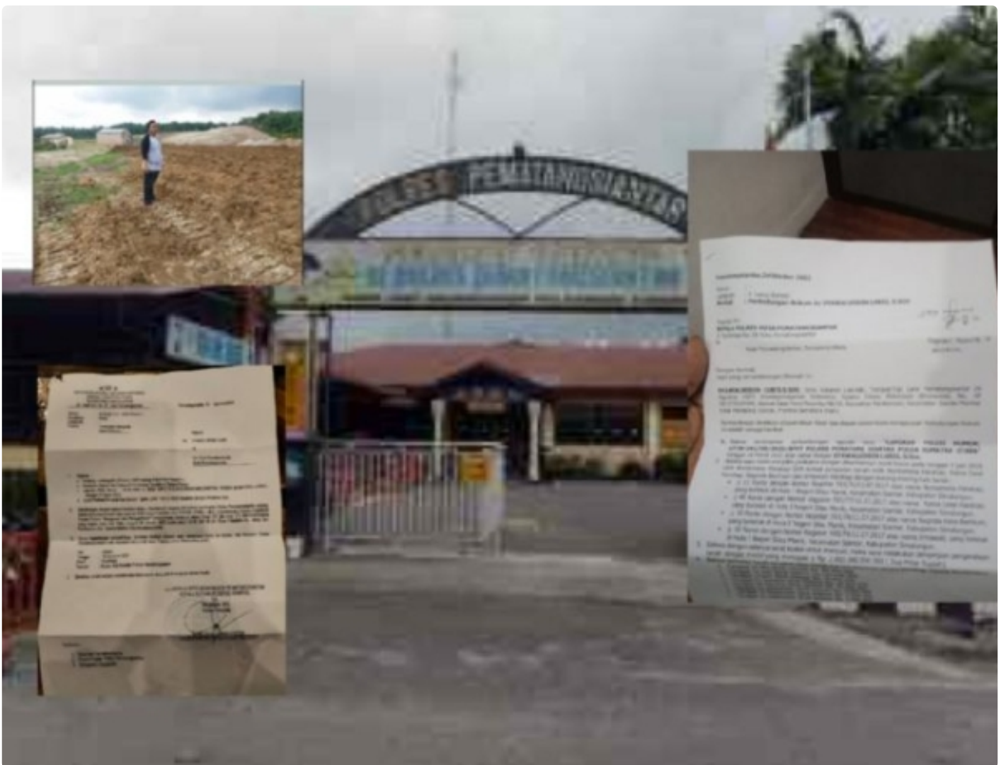
Keterangan Photo : Mako Polres Kota Pematang Siantar